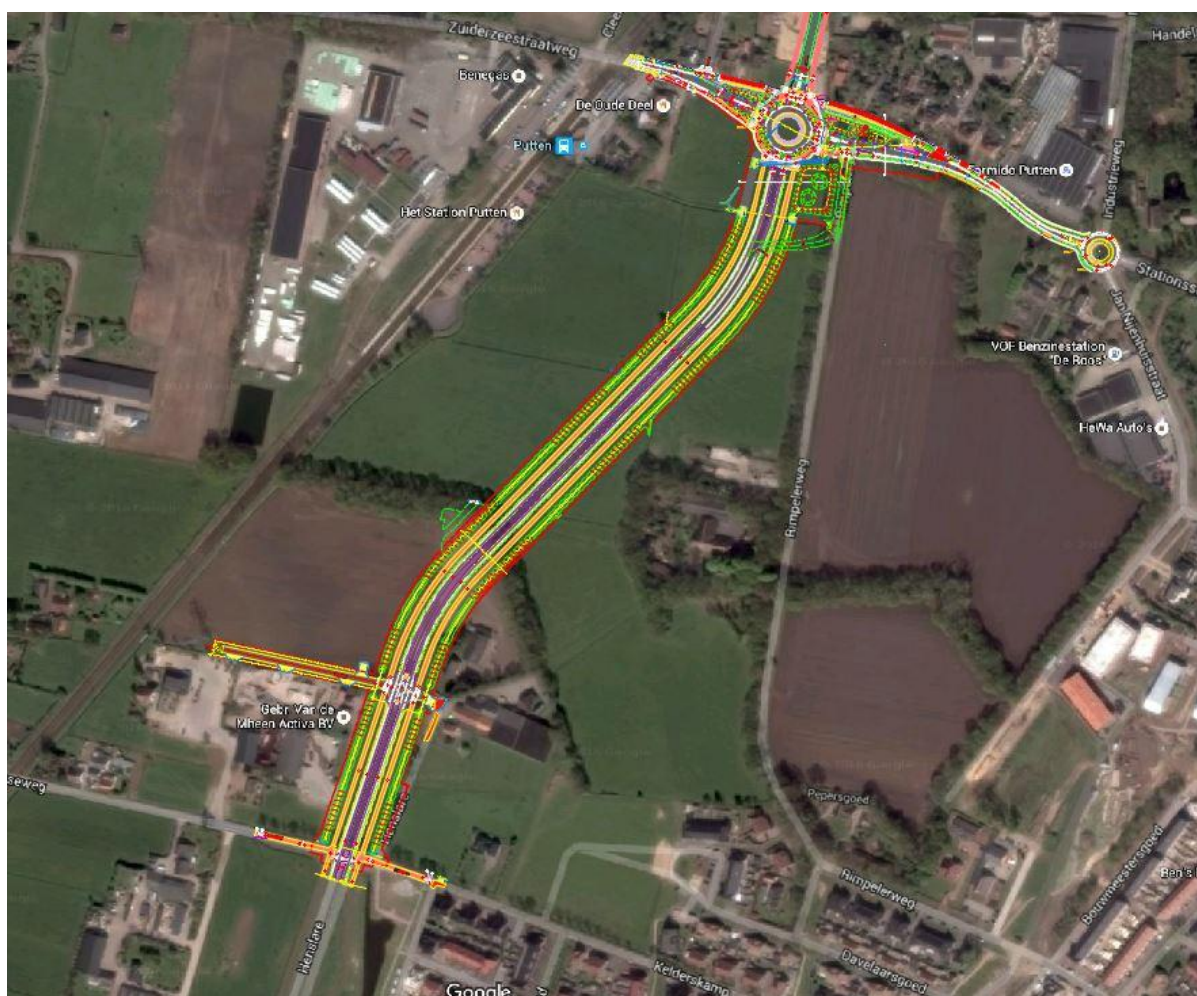
Figuur 1: Overzichtskaart met locatie van de Henslare II

Het uit te voeren werk is gelegen tussen de Stenenkamerseweg (nabij de Henslare I) en de Stationsstraat/Zuiderzeestraatweg te Putten in de gemeente Putten.